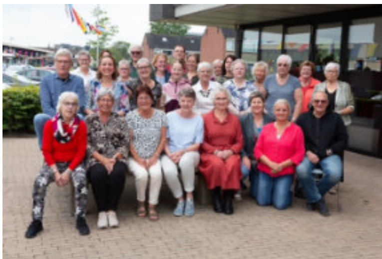
Namens de vrijwilligers van De Koeberg: tot gauw!

Vrijwilligers zijn de olie in de maatschappij. Of je nu wekelijks koffie schenkt, kookt of een creatief project realiseert, of je helpt mee tijdens een activiteit, of je zet het wijkkrantje in elkaar of je maakt foto's. Wij zijn erg blij met jullie en hopen dat wij weer veel mooie activiteiten samen gaan realiseren.