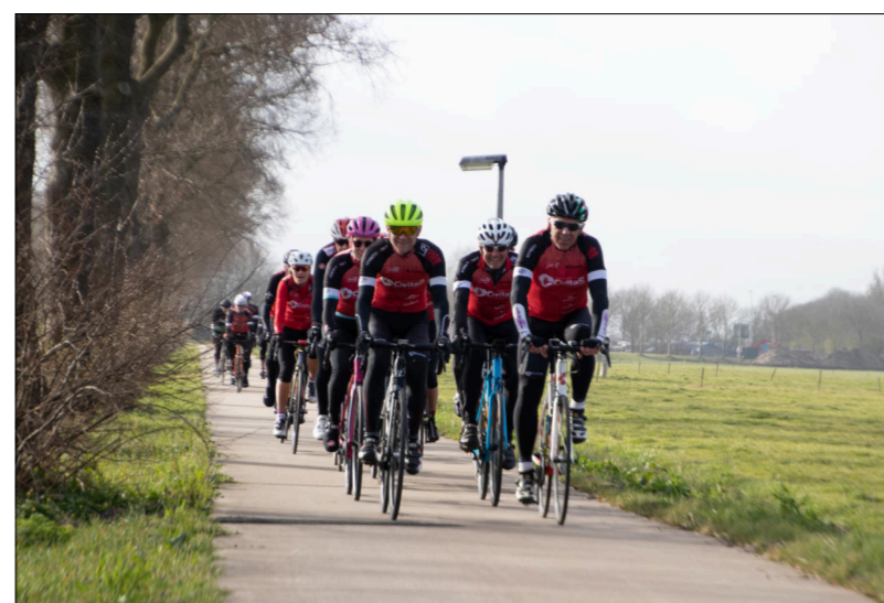
Openingsrit 2023